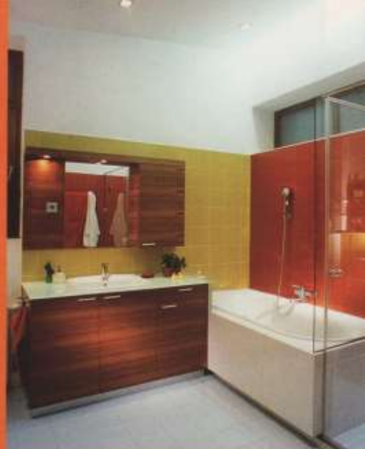
Fürdőszoba: vidám színek és elegáns kidolgozás együttese