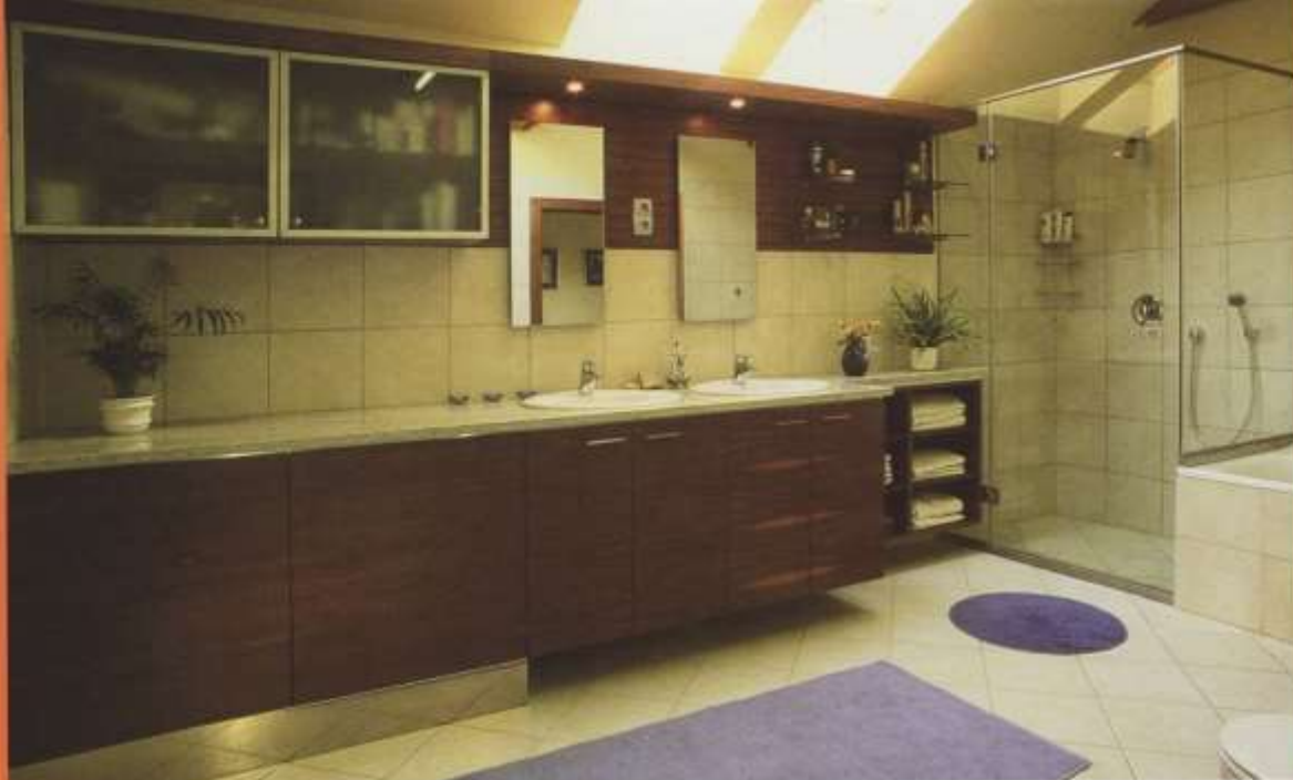
A tágas fürdőszoba a mosdópultba épített mosó- és szárítógéppel