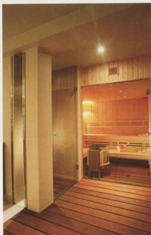
A szauna és a tér szimbiózisát a folyósószerűen befutó fapadozat és a kitekintő üvegfal adja

tek, kapcsolatok magas színvonalú, aprólékos megtervezésére. Nem szeretem, ha a munka csupán első pillantásra meggyőző, ámde részleteiben kidolgozatlan.