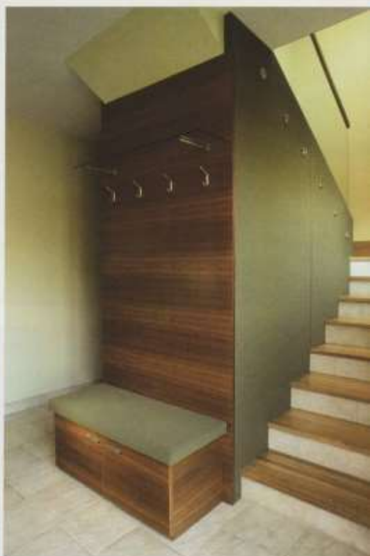
A különleges bőr falburkolat egyben az üvegkorlát tartószerkezete

Szerettem volna én is olyan tárgyakat készíteni, amelyek felveszik a versenyt a külföldi nagyokkal. Egy évbe telt, míg 1996-ban végre sikerült bátyámat rávenni, hogy dolgozzunk együtt. Az ő félig kész családi házában garázsában és pincéjében kezdtük készíteni bútorainkat, azóta üzemünk 460 négyzetméterre növekedett, közel ekkora raktárral.