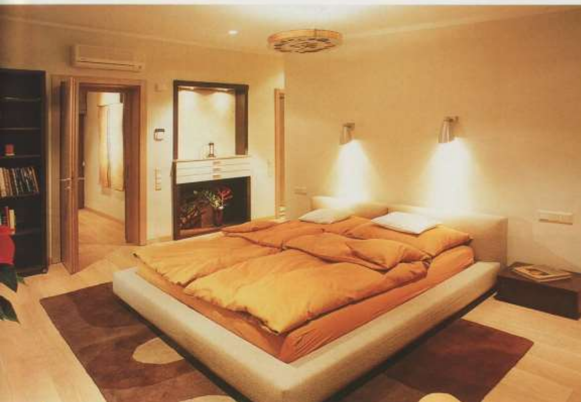
A hálószoba a mögötte rejtőző gardróbbal és fürdővel