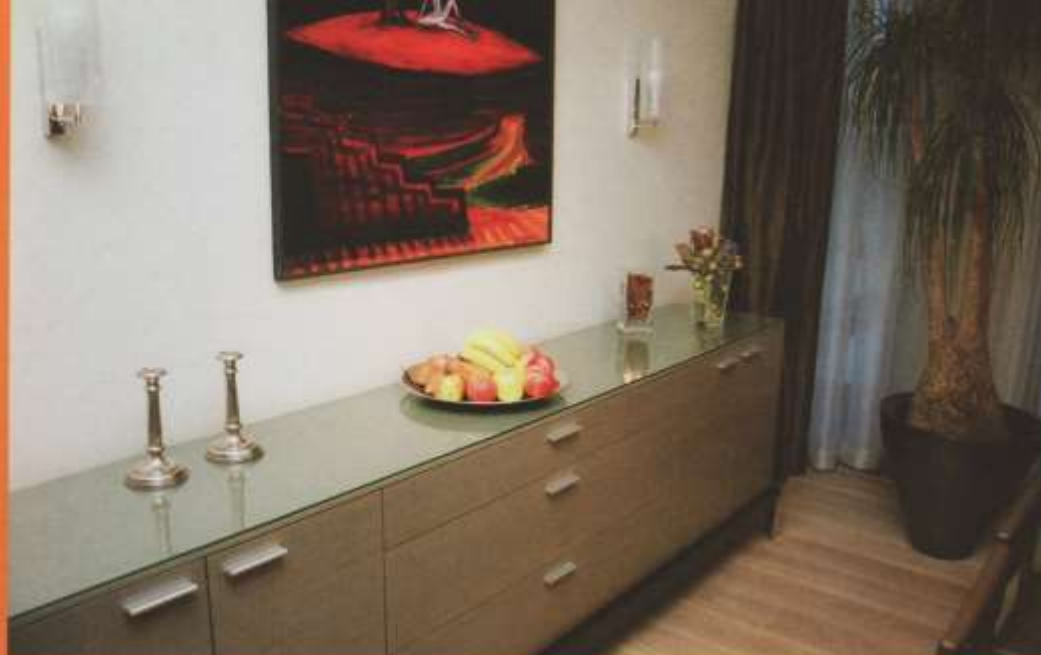
Művészi igényességgel megformált tálalószekrény