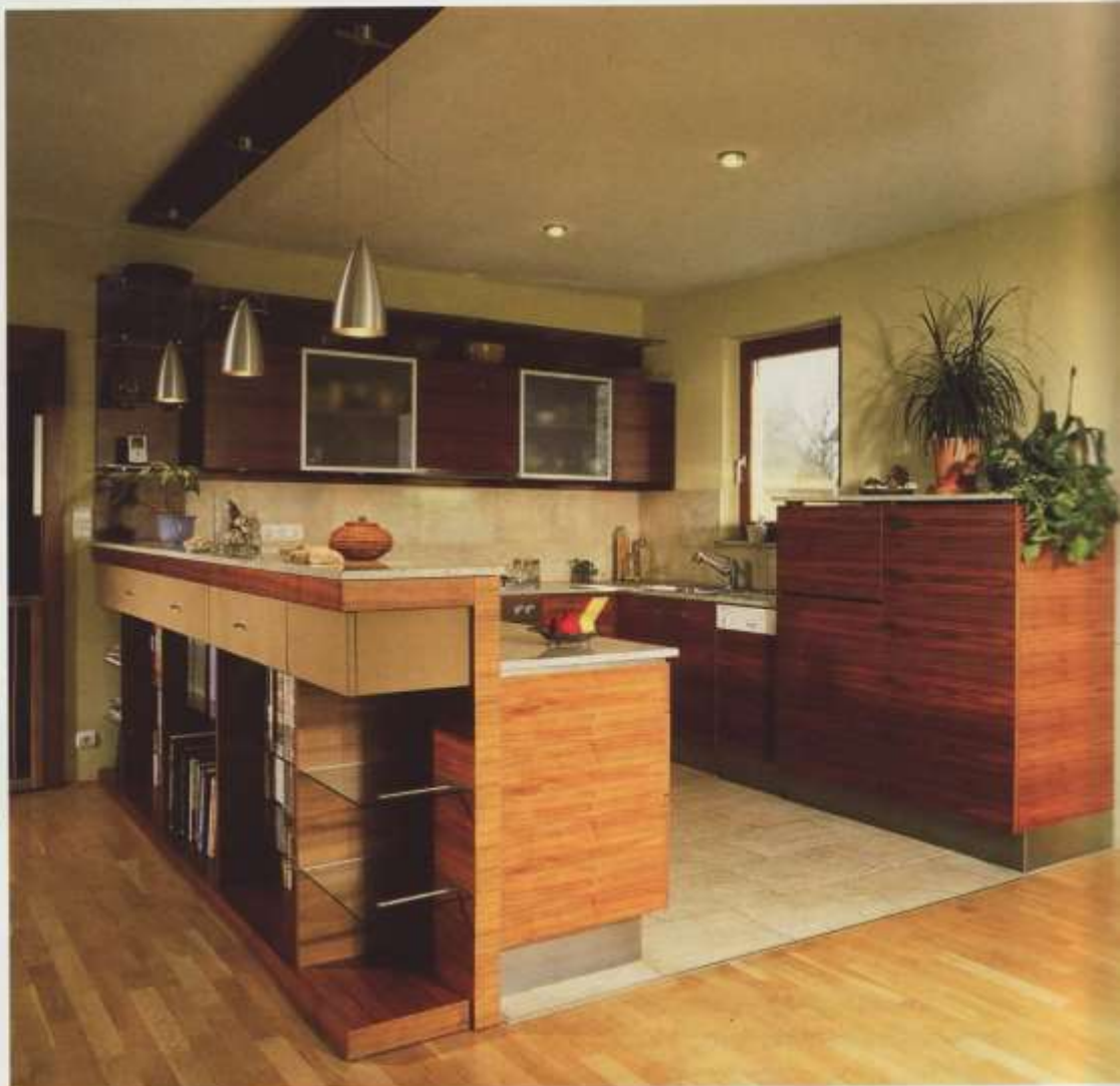
Az amerikai dióból és gránitból készült konyha a nappali felé forduló szekrénycsoporttal

Az a célom, hogy a tárgyaimban hosszú időn át lehessen gyönyörködni anélkül, hogy megunná őket.