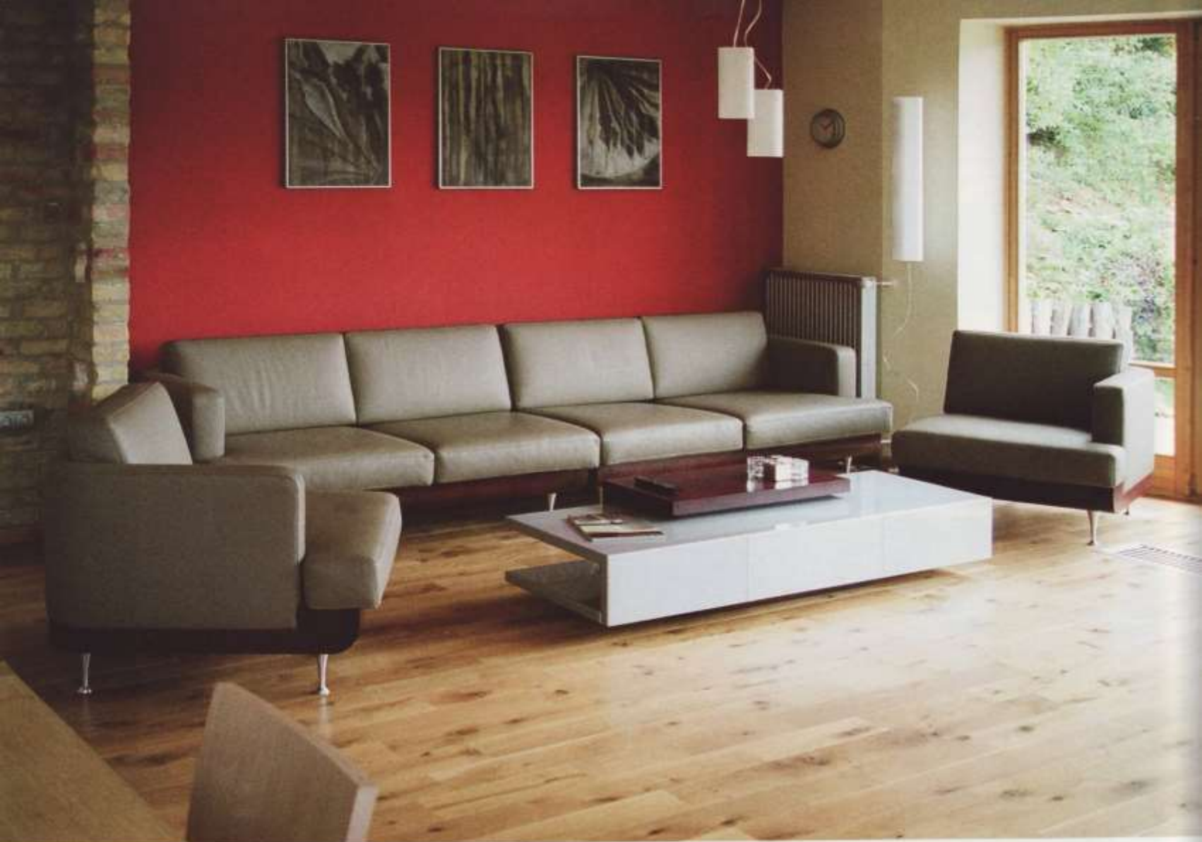
A finom vonalú egykarfás fotelek variálhatóvá teszik a nappali elrendezését.

Egyaránt kedvenceim a Bauhaus, az art deco és a szecesszió geometrikus irányzata. Persze ez nem jelenti azt, hogy ne terveznék más stílusú enteriőröket is. Számomra nem annyira a formavilág, mint inkább a finom és átgondolt kidolgozás a mérvadó. Eddigi munkáink között nagyobb részben szerepelnek modernek, de számos példát tudnék mondani antik hangulatú enteriőrökre is. Utóbbiakat igazi kihívásnak tekintem. A tervezést kiegészítő kutatómunka során olyan ismeretekre tesztek szert, melyeknek nagy hasznát vehetem más, akár modern stílusú munkáim során is. A különböző stílusok beható ismeretét azért is tartom fontosnak, mert folyamatosan új dolgok kidolgozására töreksem. Nem ragadok meg egy-egy irányzatnál. Szívesen alkalmazok új, a