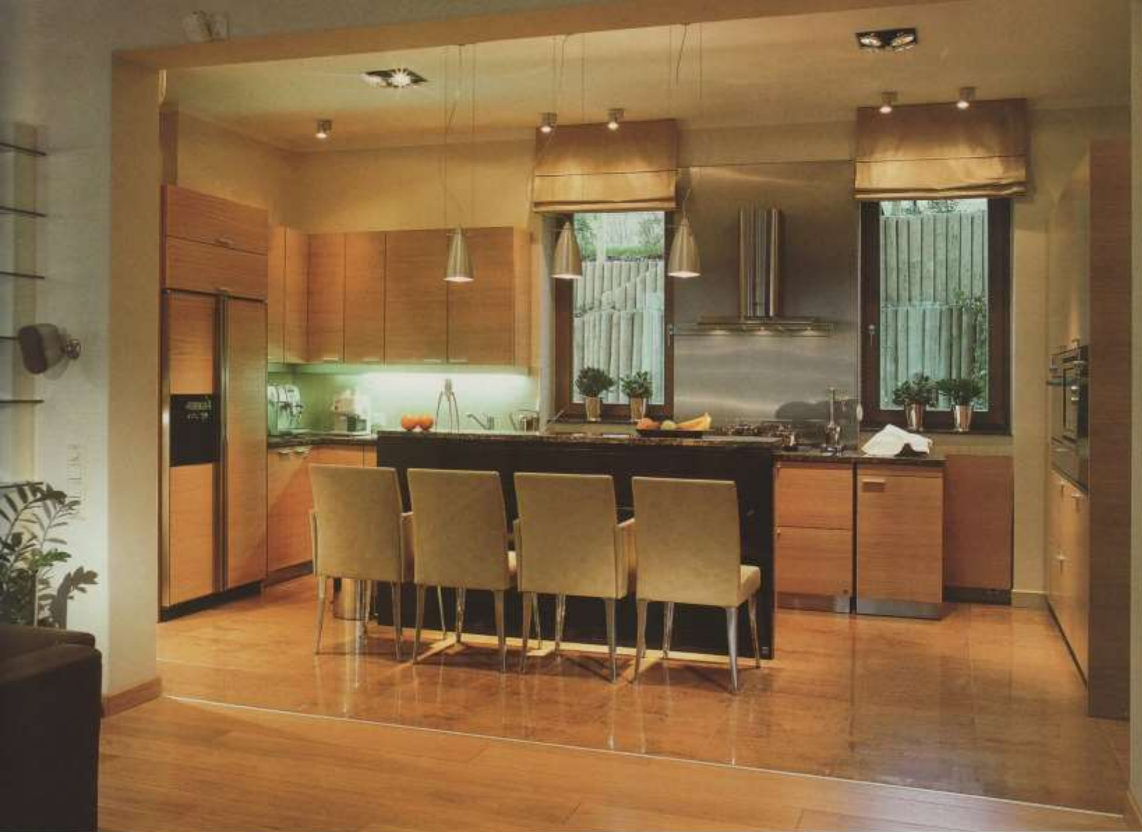
Fehértett tölgyből készült konyha a nappali és az étkező között