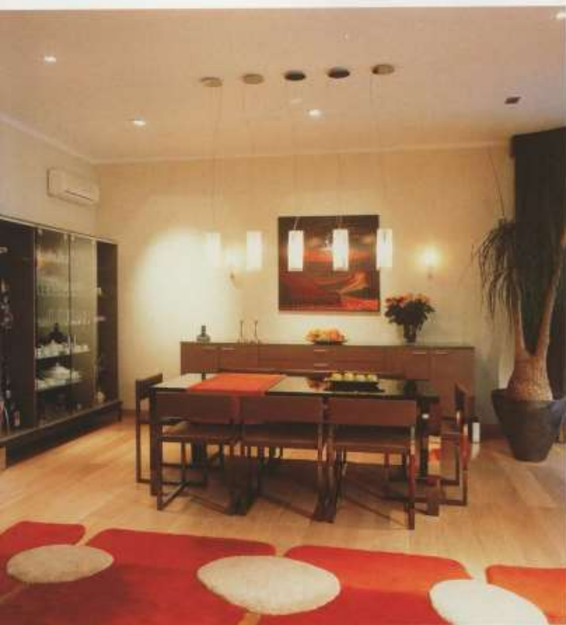
A makazár ében és a különleges, szürkére pácolt bútorok alkotta étkező