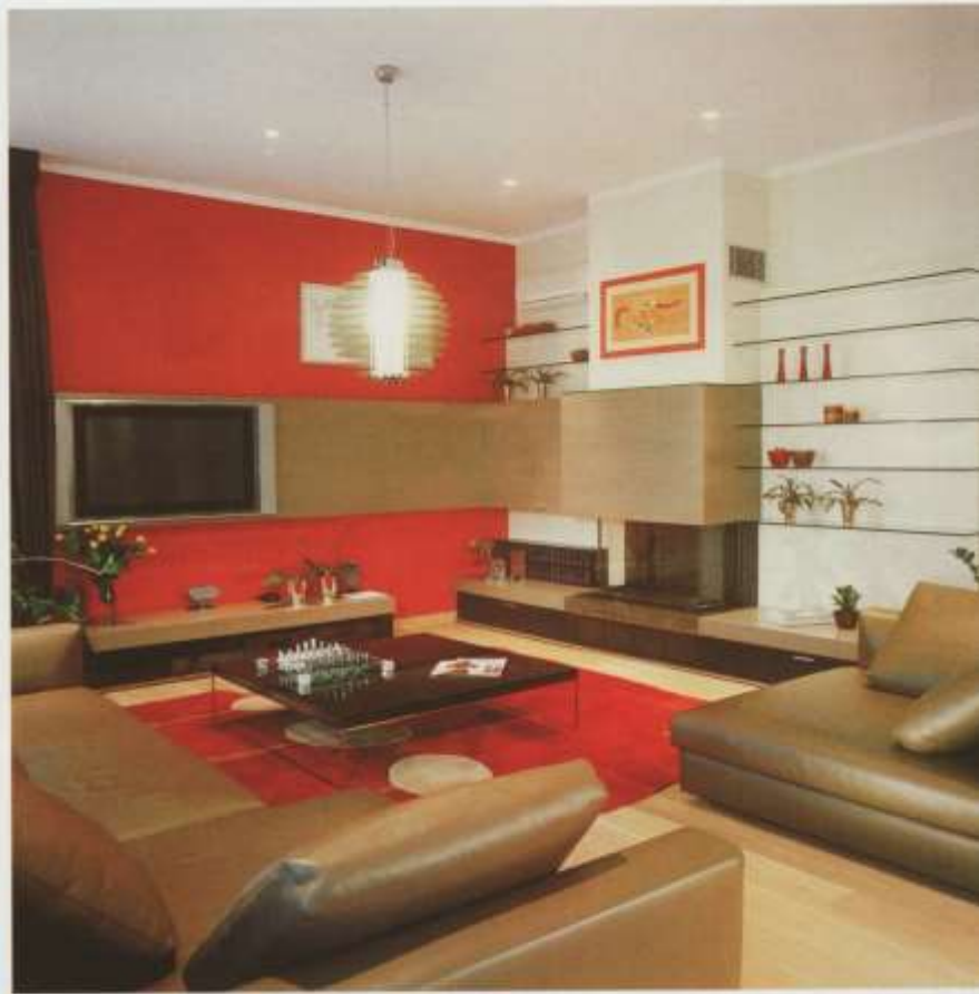
A nappali eleganciáját fokozza a berendezés részét alkotó kandalló és a bútorba süllyesztett plazmatévé szándékos visszafogottsága.