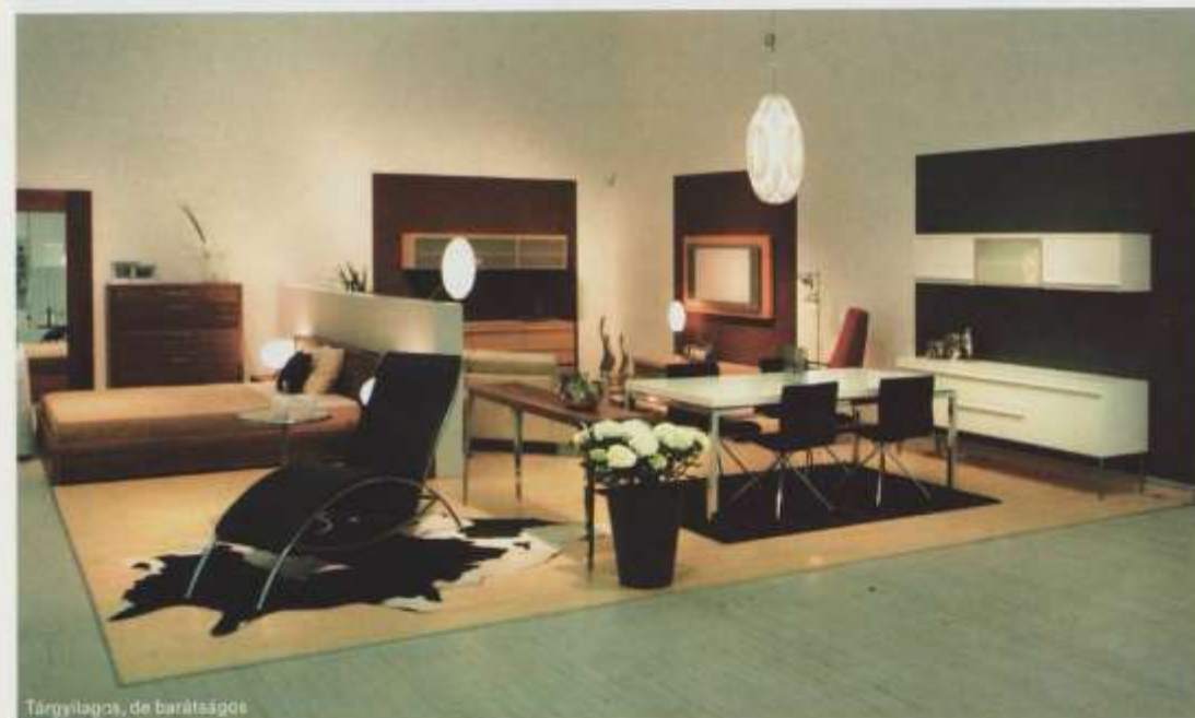
Tárgyilagos, de barátságos

túltengett a fürdőszoba-univerzum. Szó se róla, gusztusos, vonzó mindenség ez, és az egészségkultusz velejárója. Ebben is a nagy német, francia, olasz nevek aratnak, de több mozgást, újdonságot fölmutatva, mint a szobabelsőkben. A Zucchetti csaptelepek, ezek „a víz álmaként” dédelgetett formák például határozottan megragadják a nézelődőt, noha az jó ideje a bőség zavarával küzd ezen a téren. Akad teljesen újszerű, geometrikus formájú, de a high-techre emlékeztető modelljük is, merőben új megjelenéssel. És ami legalább ennyire fontos: ötéves garanciát nyújtanak. Annál fontosabb ez, mert már jó ideje rájöttünk: a kerámiabetét sem az a csodapók. Persze pompásan villogtak a Villeroy & Boch szaniterjei is, se szeri, se száma a kád, zuhanyzó és mosdó újdonságainak, pedig minduntalan azt gondoljuk, már nem lehet újat kitalálni.