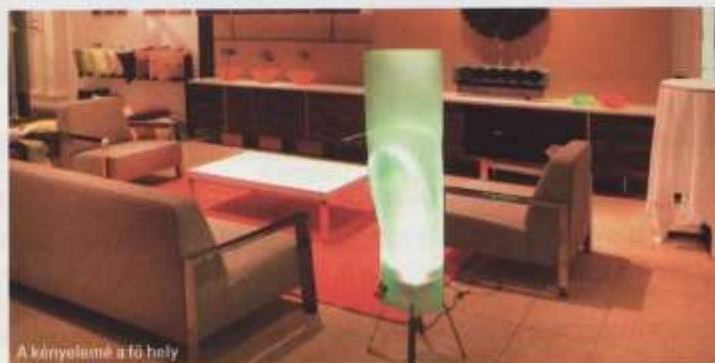
A kényelem a fő hely

Pedig lehet, hiszen – és ezzel nem erre a bemutatóra célzunk – fölalták már a komiszul kényelmetlen fürdőkádat is. A konyha alighanem az egyetlen idetartozó műfaj, amely hézagossabban szerepeít ezúttal. Tetejébe eluraikodtak a terpeszkedő nagykonyhák, szinte vendéglátóipari méretekben, gondolván, ez kell az „amerikai konyhákba”. Pedig ez az okoskodás legalábbis kétesélyes. Nem így a bútorbemutató Budapesten. Az még mindig sikerre van ítélve.