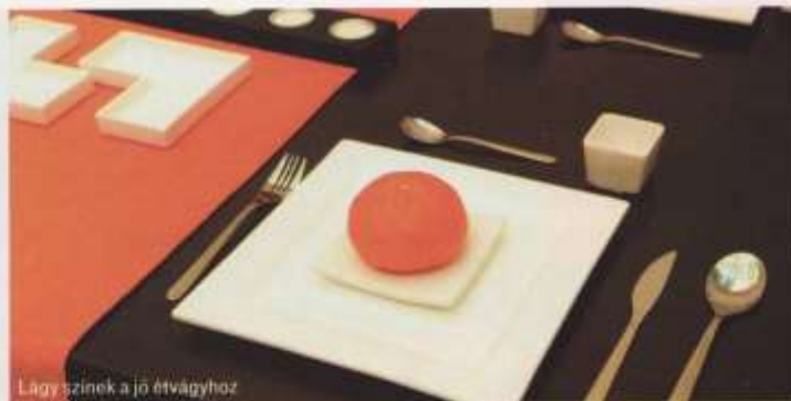
Lagy színek a jó étvágyhoz

Két különleges luxusautó állt a budapesti Műcsarnok bejárata előtt, illő csodálatra várva. Benn az idei Lakástrend kiállítás dizájn bútorai és egyéb berendezési tárgyai – plusz még egy autó – nélkülük is kivívták a megérdemelt elismerést. Nem mintha valami merőben újat képviselne ez a trend. Szó sincs róla. De ezt nem is lehet elvárni az európai bútorgyártás, konyha- és fürdőszobacikk-ipar akár legrepresentatívabb képviselőitől sem. Még ha a tervezők bírnák is szusszal. Ez a szakma is, némi főlöszleges lihegés árán, rájött arra, hogy céltalan újabb és még újabb „éívezeti” bútorzatot tukmálni a közönségre, amikor az még a korábbival sem lakott jól.