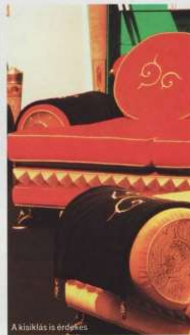
A kiállítás is érdekes

például az úgynevezett BoConcept. Választéka, az adott „koncepción” belül, szinte mindent tud. És a végtelenségig akkurátus. Ezt már a bemutatott együttesek is bizonyítják, a vaskos, magyar nyelvű katalógus még inkább, amely éppen olyan nett, mint maguk a bútorok. Igaz, valami egyhangúság, szürkeség is ül rajtuk. Hogy azt ne mondjuk: unalom. Ez természetesen abszolút szándékos, a skandináv dizájn egy karakteres irányzata. Mindenesetre rendet és nyugalmat tükröz, talán jólétet is.